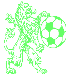
"sportvereniging" DE HOLLANDSCHE LEEUW