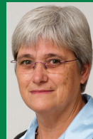
Marina La Vos lid